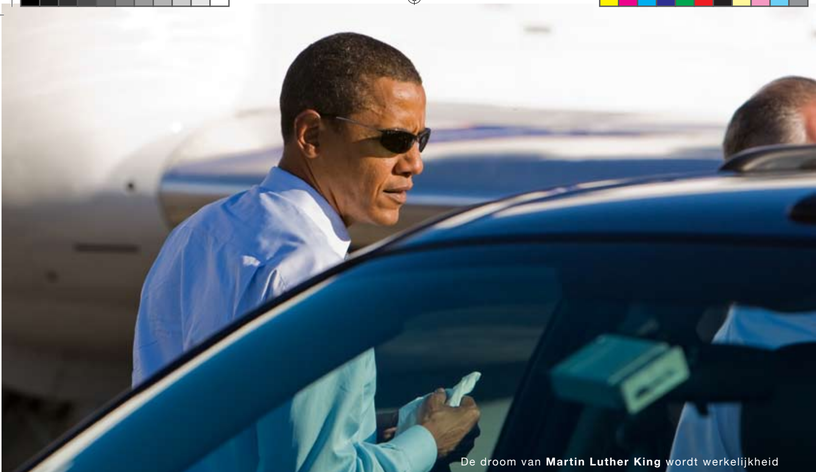
De droom van Martin Luther King wordt werkelijkheid